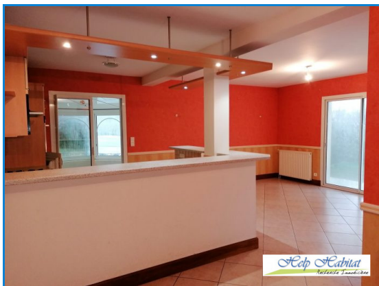
Séjour coin cuisine accès véranda et terrasse